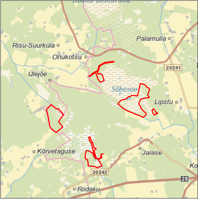
Kaardileht nr 631 Rapla